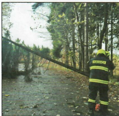
Následky Orkánu Herwart - pád stromu přes komunikaci Haslice