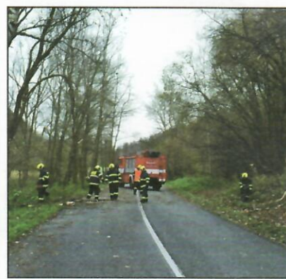
Následky Orkánu Herwart - pád stromu přes komunikaci MB - Leština