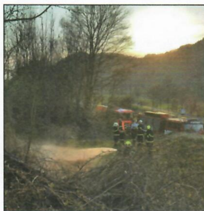
Požár lesního porostu - MB - Přerov