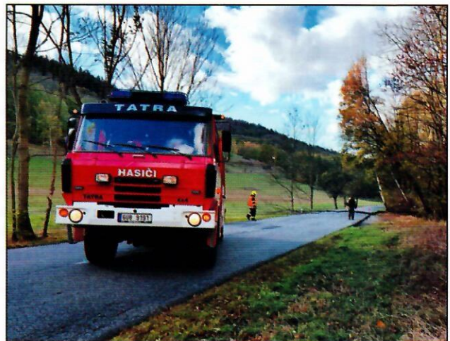
Technická pomoc - Leština (24.10)