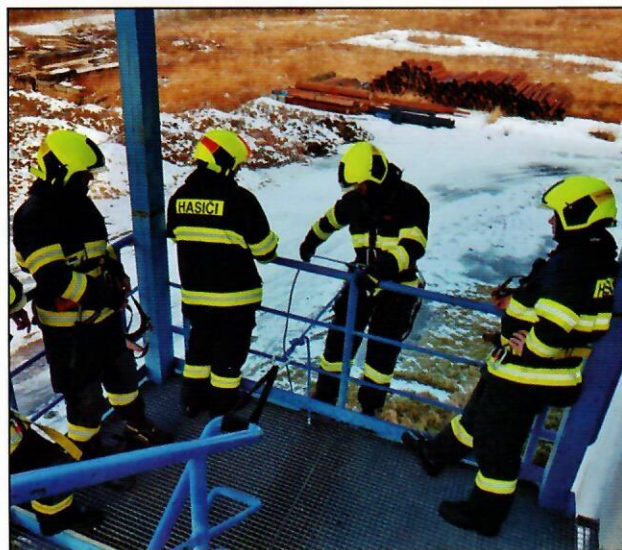
Technická pomoc únik nebezpečných látek na pozemní komunikaci - Byňov (22.07.)