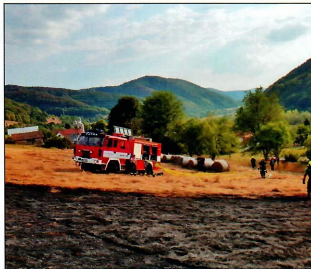
Požár travního porostu - Těchlovice (19.8.18)