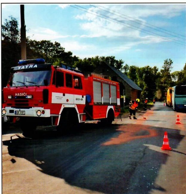
Výcvik jednotky - Ústí nad Labem (21.1.)