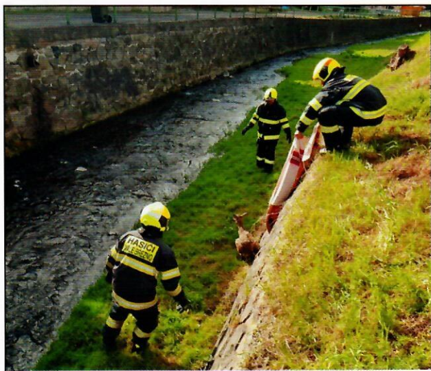
Technická pomoc odchyt srnčí zvěře - Malé Březno (12.4.)