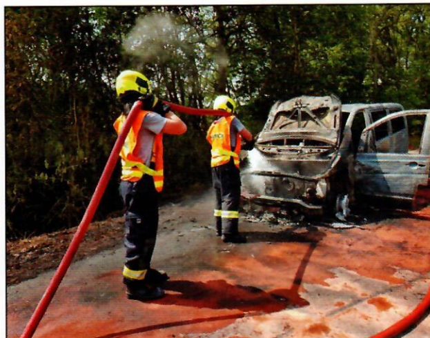
Požár mikrobusu - Zubrnice (23.7.)