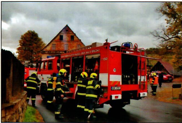
Taktické cvičení skanzen Zubrnice (25.10.)